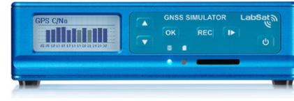
LabSat 3 Wideband